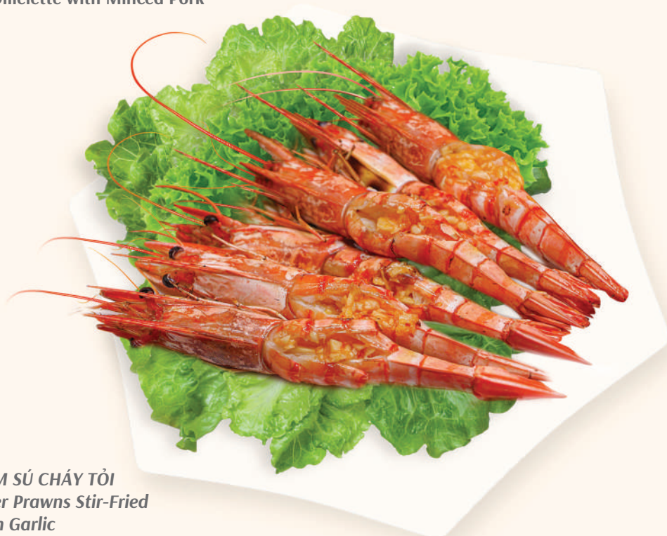
TÔM SÚ CHÁY TỎI Tiger Prawns Stir-Fried with Garlic