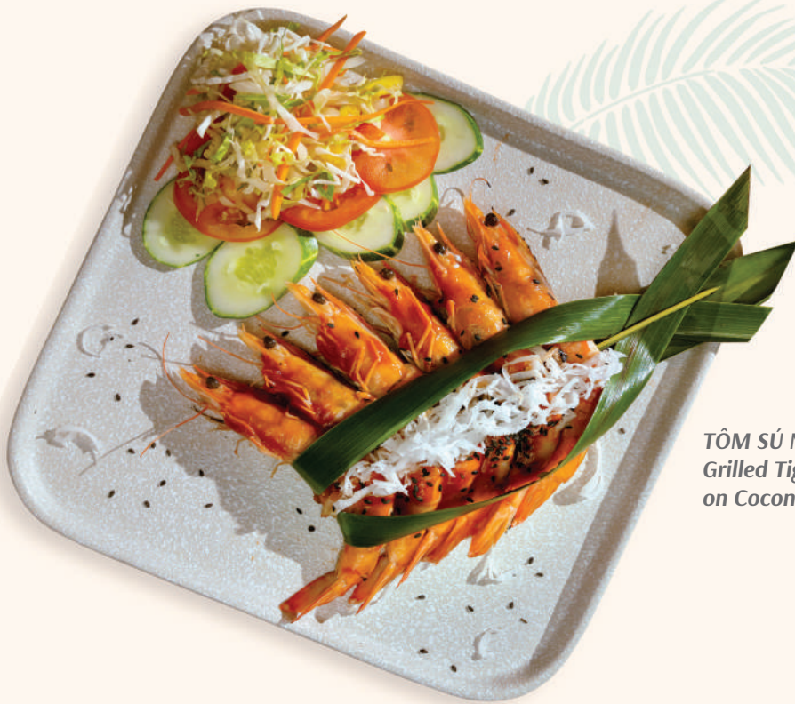
TÔM SÚ NƯỚNG LÁ DỪA Grilled Tiger Prawns on Coconut Leaf