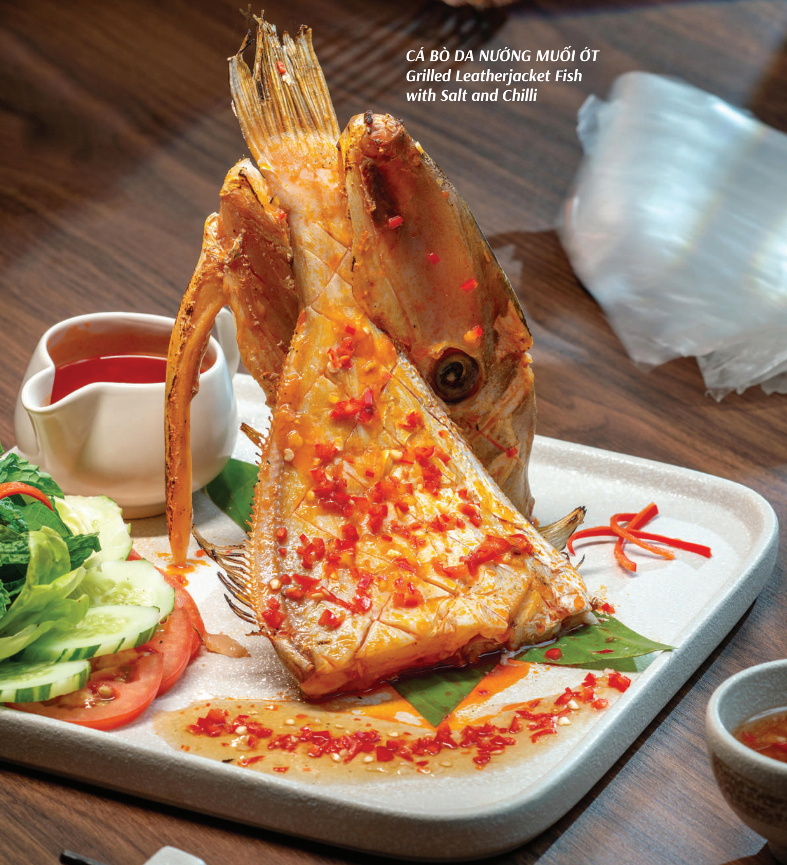
CÁ BÒ DA NƯỚNG MUỐI ỚT Grilled Leatherjacket Fish with Salt and Chilli