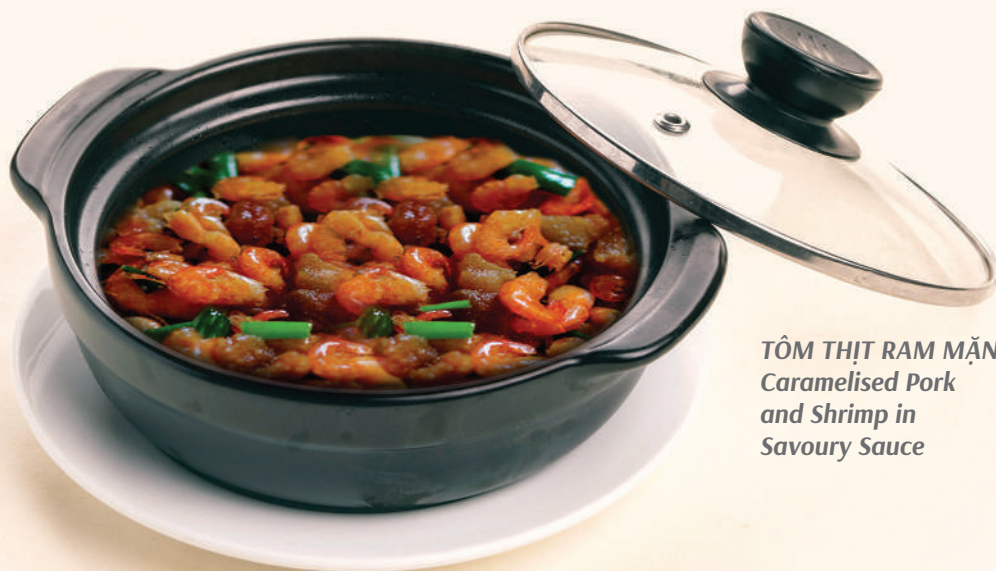
TÔM THỊT RAM MẶN Caramelised Pork and Shrimp in Savoury Sauce