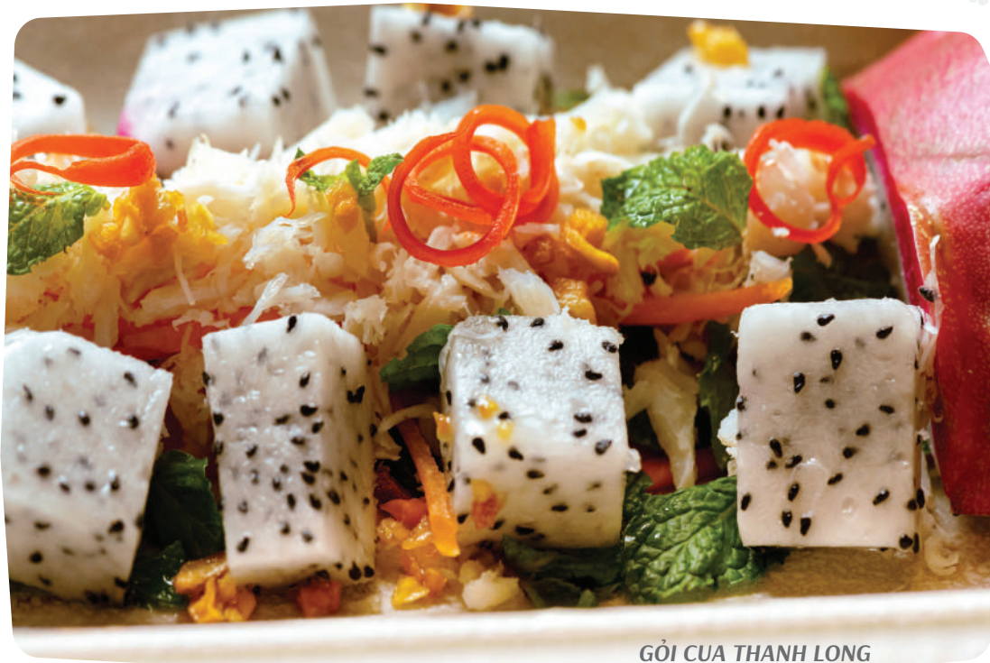
GỎI CUA THANH LONG Dragon Fruit Salad with Crab Meat