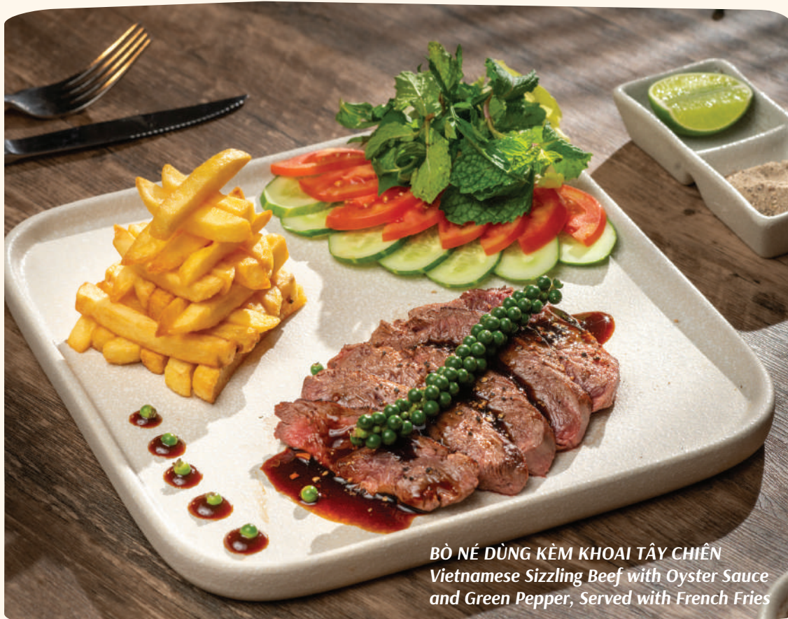
BÒ NÉ DỪNG KÈM KHOAI TÂY CHIÊN Vietnamese Sizzling Beef with Oyster Sauce and Green Pepper, Served with French Fries

🐔 Món cay • Spicy 🌿 Món chứa tinh bột • Contains gluten 🥜 Món chứa các loại hạt • Contains nuts 🥛 Món chứa sữa bò • Contains lactose