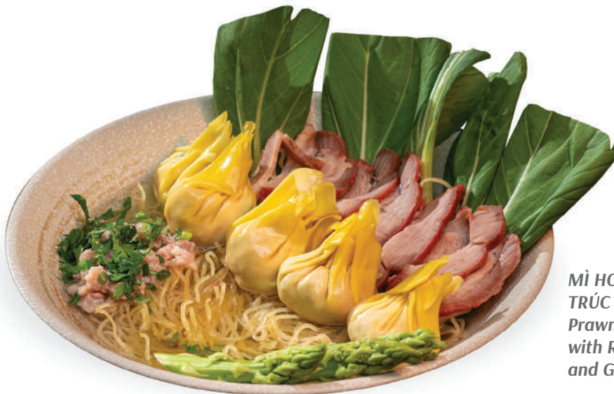
MÌ HOÀNH THÁNH TRÚC XANH Prawn Wonton Soup with Roasted Pork and Green Asparagus

🌶️ Món cay • Spicy 🍴 Món chứa tinh bột • Contains gluten 🌰 Món chứa các loại hạt • Contains nuts 🥛 Món chứa sữa bò • Contains lactose