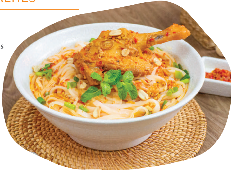
MÌ QUẢNG VỊT Specialty Rice Noodles with Braised Duck