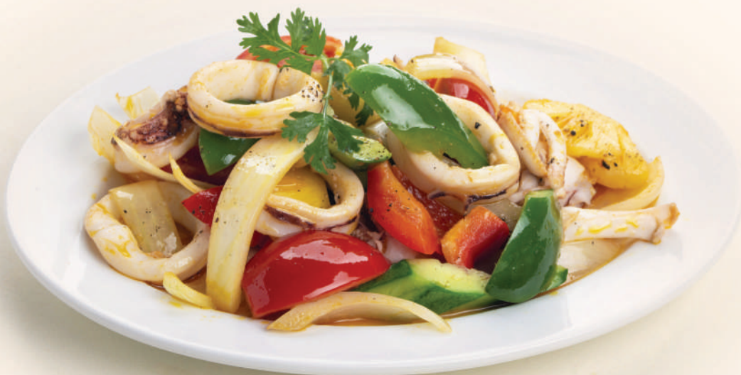
MỰC ỐNG XÀO CHUA NGỌT Stir-Fried Squid in Sweet and Sour Sauce

🌶️ Món cay · Spicy 🍷 Món chứa tinh bột · Contains gluten 🌰 Món chứa các loại hạt · Contains nuts 🥛 Món chứa sữa bò · Contains lactose